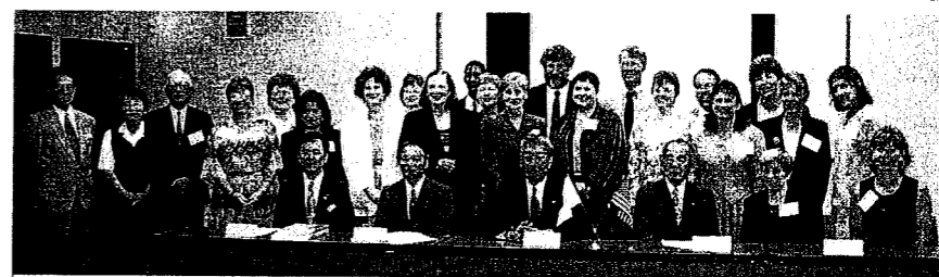
越谷市長を表敬訪問したアメリカ人グラントーら。

授業後、日米の先生たちが3グループに分かれて懇談。アメリカ人側は、まず校長先生の権限について質問。「私には権限も何もないのです」。教頭先生は「私はただ校長先生のやらないことを助けている」