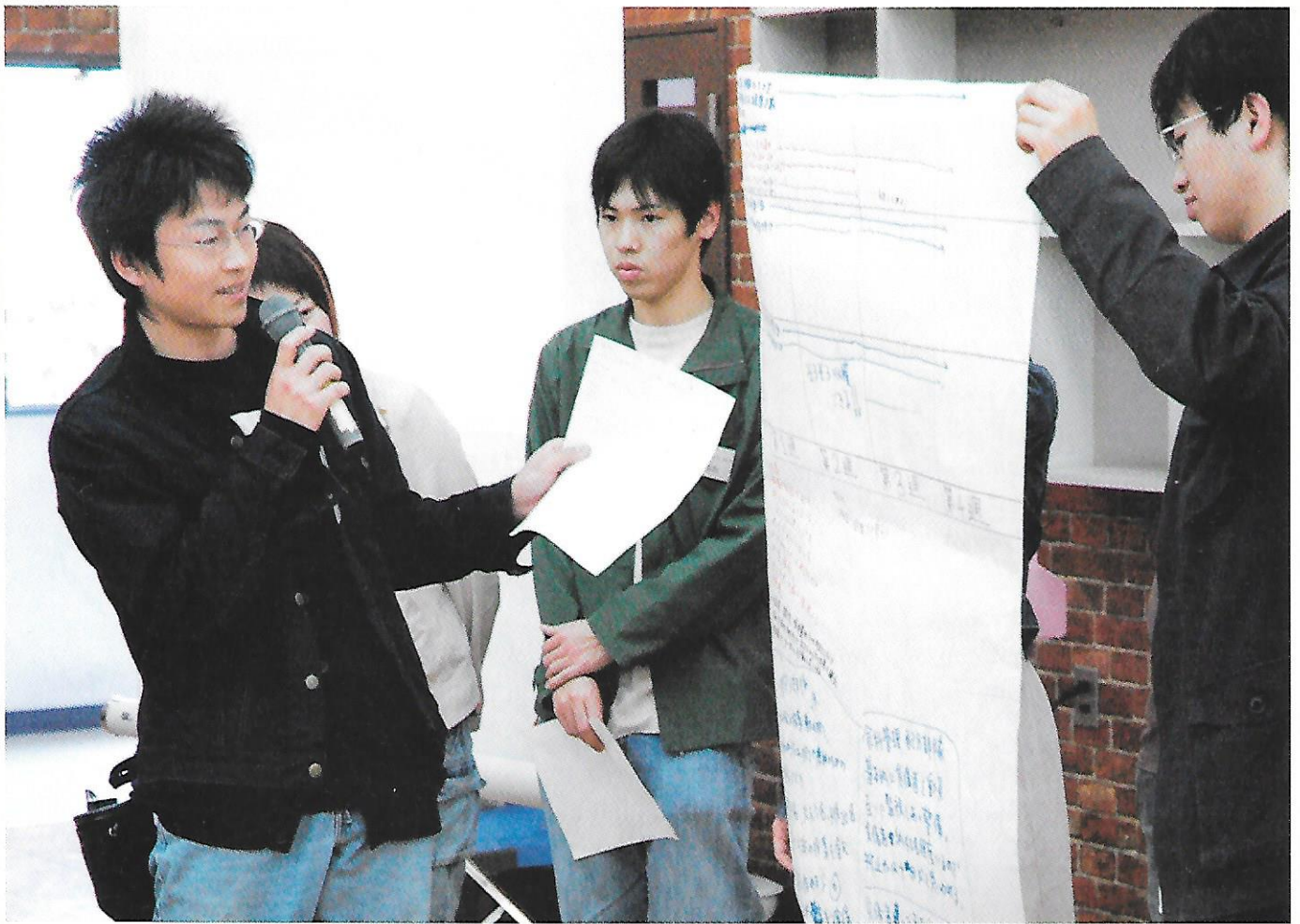
平成18年度全代会合宿研修会 (H18.5.5~6)